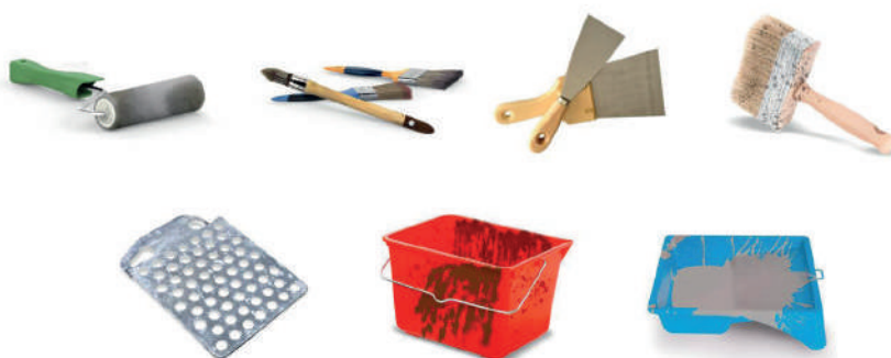
Pinceaux et brosses à peinture, rouleaux et manchons à peinture, couteaux, bacs plats à peinture et recharges, bacs et camions à peinture, recharges et grilles...