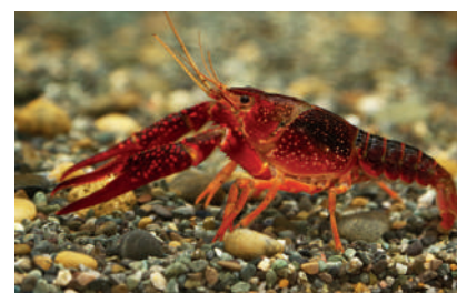
Écrevisse de Louisiane

mammifère semi-aquatique rencontrée sur l'étang pendant la période de prospection. La recherche de la loutre d'Europe en périphérie n'a pas apporté de résultat. Deux stations d'écoute des chauves-souris ont permis de recenser quatorze espèces sur le site. La structure de l'habitat et sa composition sont favorables à une grande diversité d'espèces pour la chasse : alignement d'arbres, ripisylve, prairie. Pour les invertébrés, vingt-deux espèces de libellules ont été identifiées dont une espèce protégée.