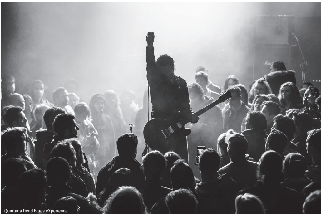
Quintana Dead Blues eXperience

On pensait les Silmarils perdus dans les limbes rap soporifiques mais « 4 Life », leur 4 e album vient rappeler que le groupe rock n'est pas encore mort, pas encore !