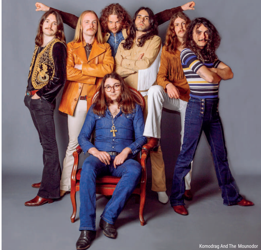
Komodrag And The Mounodor